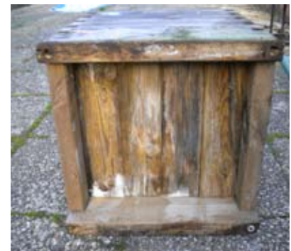
Jardinière en bois, attaquée par des champignons et des moisissures.

Le bois doit être traité avant l'utilisation afin d'améliorer sa durabilité. Pour les utilisations à l'extérieur, les procédés de traitements courants comportent pour la plupart l'addition des produits chimiques. Mais malgré le traitement, le bois pourrait être le siège de développements fongiques. On redoute également le développement de moisissures et de champignons. Il est difficile de nettoyer le bois par un simple coup de chiffon. Alors que la jardinière Hortense est au contact direct de son utilisateur, et lui apporte un bon appui, le bac en bois devient inapproprié quand il reste à l'extérieur au bout de certains temps. Il ne peut, non plus, être admis en milieu médical.